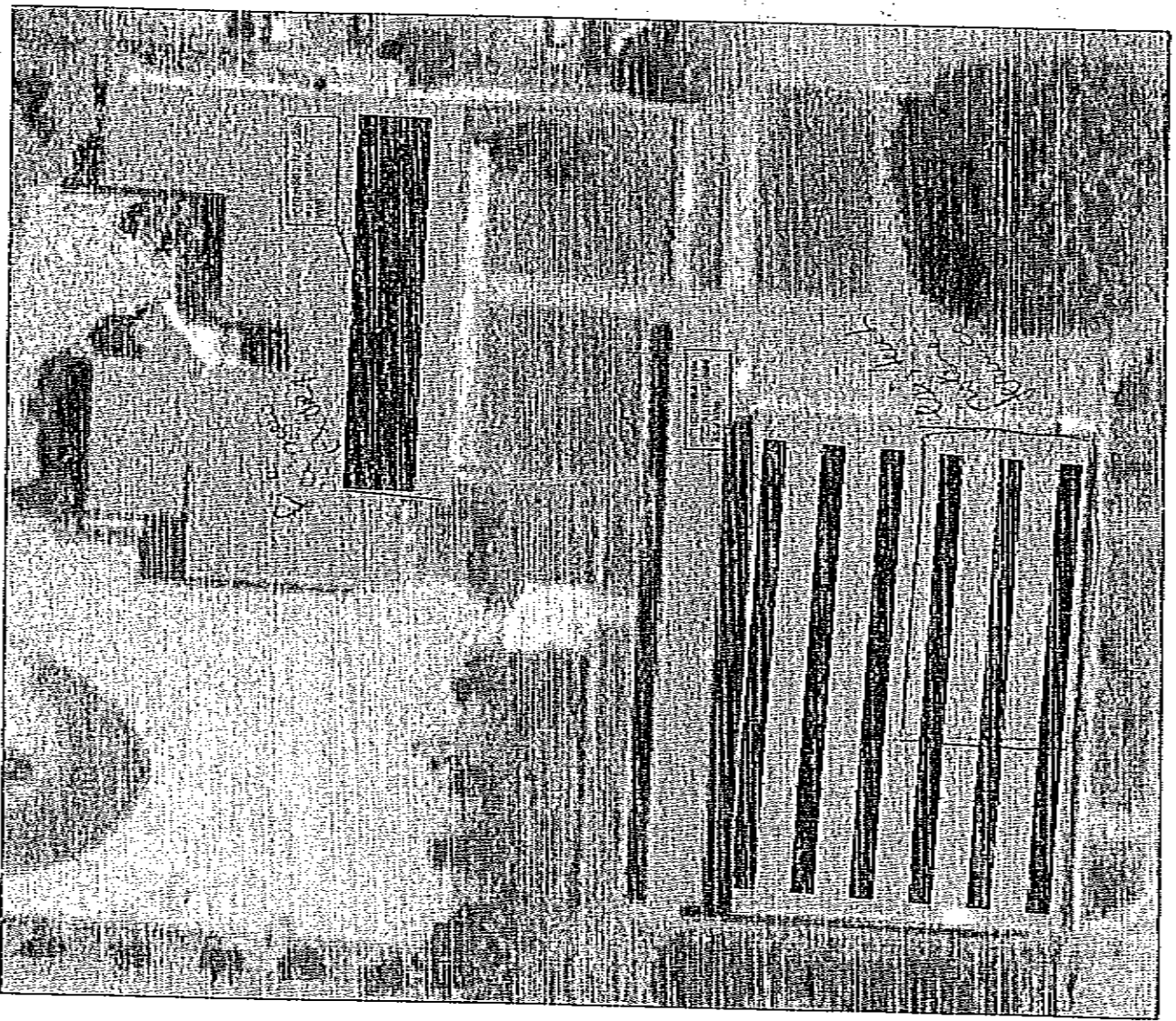
NOTA: DIMENSIONI ESTERNE IN METRI ED I CARICHI AMMESSI E DELLA COPERTURA PERMANENTE